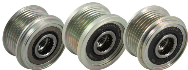
Снимка 2: Ролки за свободен ход на алтернатор 535 0063 10 (ляво), 535 0202 10 (център), 535 0203 10 (дясно)

Вибрации и силни шумове от спомагателното задвижване, могат да се появят при автомобилите изброени горе с твърда ремъчна ролка на алтернатор. Тези вибрации и шумове са причинени от ротационните несъответствия при дизеловия двигател, които са по-големи от тези при бензиновия двигател.