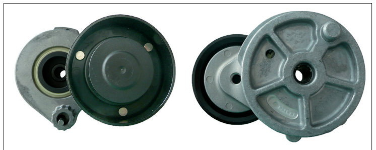
Figura 1: versión anterior