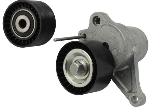
Resim 2: Plastik gergi rulmanı ve saptırma kasmağı

Metal gergi rulmanı ve saptırma kasmağı, plastik olanlarla sorunsuz bir şekilde değiştirilebilir.