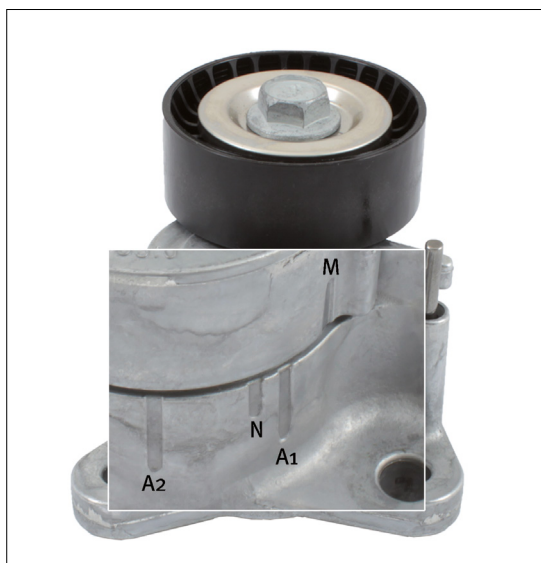
Slika 2: Spremenjene oznake za delovno območje napenjalne ročice.

Opozoriti je treba, da sta priložena pritrdilna vijaka krajša, saj ustrežata tanjši montažni prirobnici.