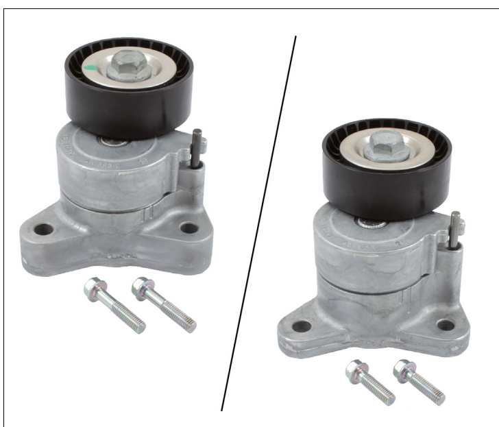
Slika 1: Napenjalna ročica 534 0325 10 – levo: stara izvedba s pritrdilnima vijakoma. Desno: nova izvedba s pritrdilnima vijakoma.

Mitsubishi: 1345A059 (zamenjan) 1345A079 (nov)