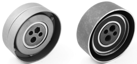
Εικόνα 2: 531 0103 20 - Προηγούμενος σχεδιασμός (αριστερά) και νέος σχεδιασμός (δεξιά)

Στα πλαίσια της συνεχούς προσπάθειας βελτίωσης των προϊόντων μας, έχουν γίνει κάποιες τροποποιήσεις στην τροχαλία τάνυσης με κωδικό 531 0084 20 και 531 0103 20.