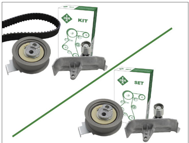
Fig. 2: Links KIT 530 0546 10, rechts Set 530 0546 09

U mag onderdelen van verschillende uitvoeringen niet door elkaar gebruiken. De onderdelen zijn per uitvoering op elkaar afgestemd en alleen dit garandeert een correcte riemspanning.