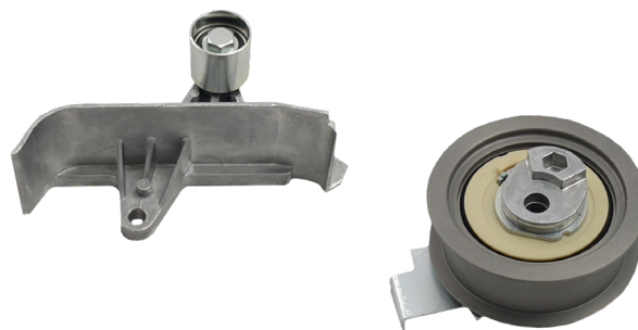
Billede 2: KIT 530 0546 10 (til venstre), Set 530 0546 09 (til højre)

I de køretøjer, der angives ovenfor, er vibrationsdæmper 533 0028 20 (billede 1, venstre) og strammer 531 0531 20 (billede 1, højre) blevet udskiftet med KIT 530 0546 10 (billede 2, venstre) og Sæt 530 0546 09 (billede 2, højre).