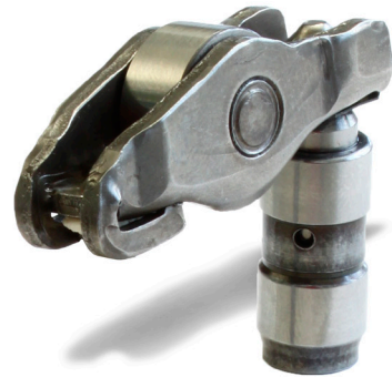
Зображення 1: Варіант 1

Номери оригінального обладнання: 036 109 411 E 036 1 09 411 G 036 109 411 H 036 109 411 J