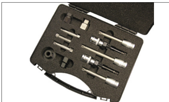
Fig. 3: Speciaal gereedschap van INA artikelnummer 400 0241 10

Voor uit- en inbouw van de dynamovrijlooprol is speciaal gereedschap (Fig. 3) nodig.