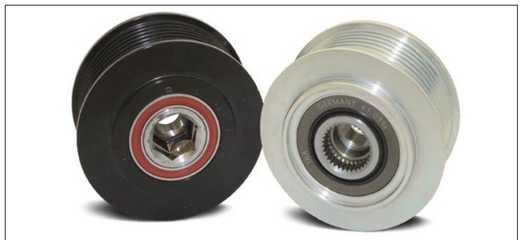
Fig. 1: Dynamovrijlooprol 535 0214 10

Bij de bovengenoemde modellen kunnen twee verschillende uitvoeringen van de dynamovrijlooprol zijn gemonteerd.