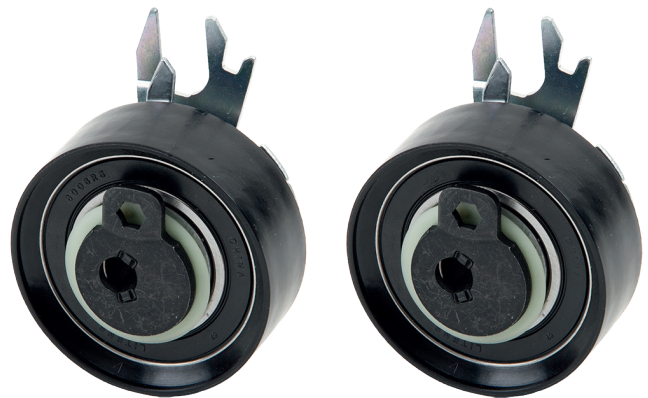
Зображення 1: Натяжний ролик 531 0252 30 (зліва), натяжний ролик 531 0525 30 (справа)

Актуальні дані можна знайти у каталозі запасних частин