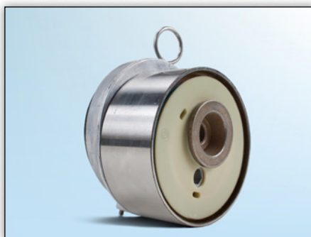
Fig. 1: Vista frontal de la versión anterior