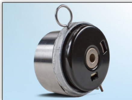
Fig. 3: Vista trasera de la versión anterior