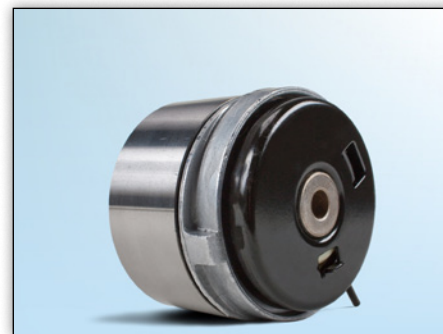
Fig. 4: Vista trasera de la nueva versión

Debido al desarrollo continuo de nuestros productos, se ha modificado el diseño de la polea tensora 531 0779 10.