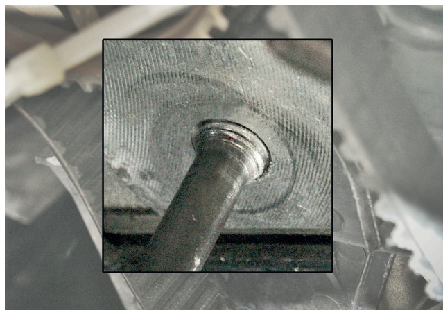
Снимка 1: Шпилката не е правилно завита

При монтажа на обтяжната ролка 531 0203 20 трябва да гарантирате, че резбата (M10) на шпилката е навита докрай и е на нивото на цилиндровия блок. Резбата не трябва да се показва от блока (виж Снимка 2).