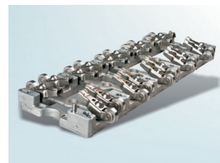
Зображення 2: Блок коромисел 423 0063 10

На сьогодні автовиробники Citroën, Fiat, Ford, Land Rover і Peugeot почали виробництво нової серії дизельних двигунів, які відповідають екологічному стандарту «Євро 4».