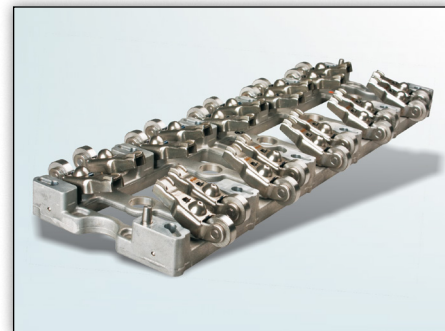
Slika 2: Nosilno ohišje nihajnih vzvodov 423 0063 10

Proizvajalci vozil znamk Citroën, Fiat, Ford, Land Rover in Peugeot sedaj uvajajo novo ponudbo dizelskih motorjev, ki izpolnjujejo evropski standard za emisije izpušnih plinov Euro 4. Razločevalni element teh motorjev je aluminjsko nosilno ohišje nihajnih vzvodov za pogon ventilov (glejte sliko 1 in 2), ki je rezultat razvoja proizvajalca INA.