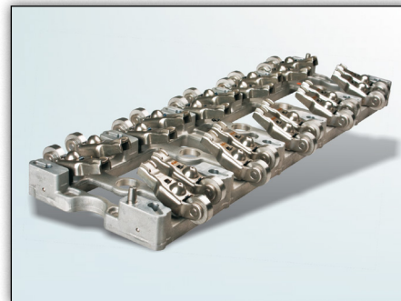
Slika 2: Sklop klackalica ventila Kat. Br. 423 0063 10

Prednost ove nove konstrukcijske jedinice je smanjenje težine motora i niža razina buk.