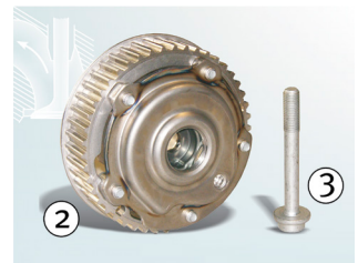
Εικόνα 2: Ρυθμιστής εκκεντροφόρου άξονα της πλευράς εξαγωγής 427 1005 10 και κεντρική βίδα 41301*