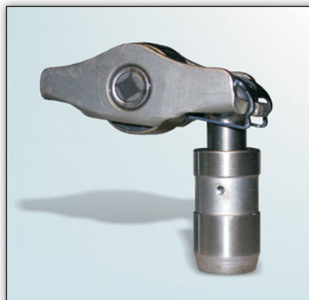
Fig. 1: Modelo 1