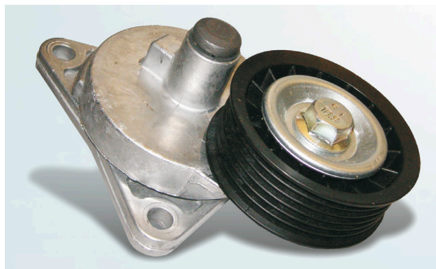
Obrázek 2: 534 0130 20 – s černou kladkou

Pro objednávací číslo 534 0130 20 dodává Schaeffler Automotive Aftermarket dvě různé varianty.