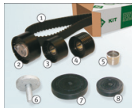
Fig. 2: Kitinhoud 530 0342 10

U vindt de overeenkomstige reserveonderdelen in onze onlinecatalogus op www.Schaeffler-Aftermarket.com of via RepXpert op www.RepXpert.com .