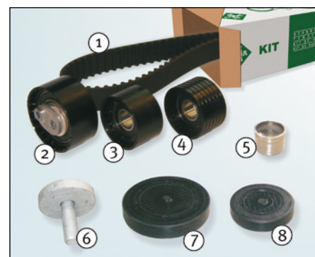
Image 2 : Contenu du kit 530 0342 10

Vous trouverez les pièces de rechange INA correspondantes dans notre catalogue en ligne à l'adresse www.Schaeffler-Aftermarket.com ou sur RepXpert à l'adresse www.RepXpert.com .