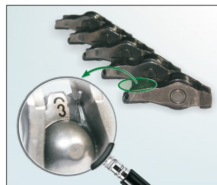
Obrázok 2: Značenie vahadiel ventilov

Príslušné náhradné dielce nájdete v našom On-line katalógu www.Schaeffler-Aftermarket.com alebo v RepXpert na adrese www.RepXpert.com .