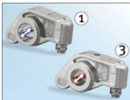
Fig. 2: De diameter van de kleptuimelaar aan de inlaatzijde (1) is groter

De onderdelen moeten op de juiste plaats worden gemonteerd. De verschillende onderdelen zijn enerzijds te herkennen aan de verschillende diameter van de boring voor de kleptuimelaaras (Fig. 2), anderzijds aan de kruk van de roltuimelaar (Fig. 3).