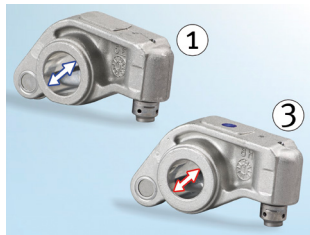
2. ábra: A szelepemelő átmérője a szívó oldalon (1) nagyobb