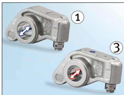
Image 2: Le diamètre du culbuteur côté admission (1) est plus grand

Assurez-vous d'utiliser les bonnes références lors du montage. Deux éléments permettent de différencier ces produits : le diamètre d'alésage pour l'axe des culbuteurs ( image 2 ) et le déport du culbuteur à galet ( image 3 ).