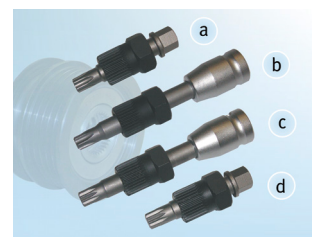
Figura 2: Prezentarea generală a unelei speciale