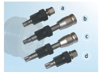
Εικόνα 2: Συνοπτική εικόνα ειδικών εργαλείων