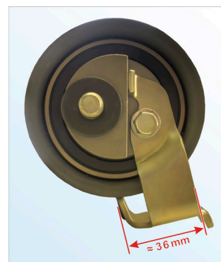
Снимка 2: 531 0500 20

При смяната на обтяжната ролка на ангренажния ремък точното определяне на превозното средство трябва да се провери.