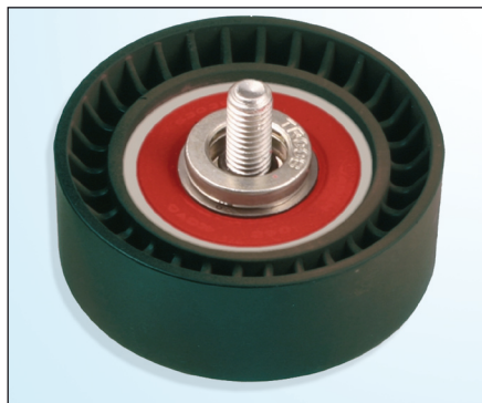
Figura 1: 532 0294 10 (vecchia versione)