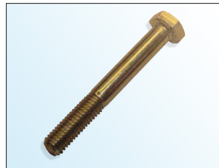
Slika 2: rezervni vijak

U okviru kontinuiranog tehničkog razvoja proizvođa LuK-AS isporučuje zajedno s kolotutom za napinjanje 531 0342 30 i novi vijak ( slika 3 ).