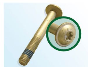
Фигура 3: LuK-AS болт

Като част от непрестанното развитие на нашите продукти и на качествения контрол, LuK AS доставя нов болт (фигура 3) с обтяжна ролка 531 0342 30.