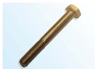
Фигура 2: OE болт