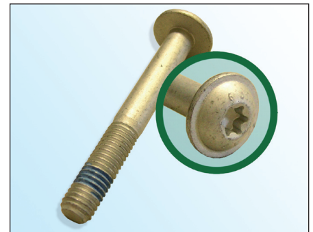
Fig. 3: Tornillo INA

¡Observar las indicaciones del fabricante del vehículo!