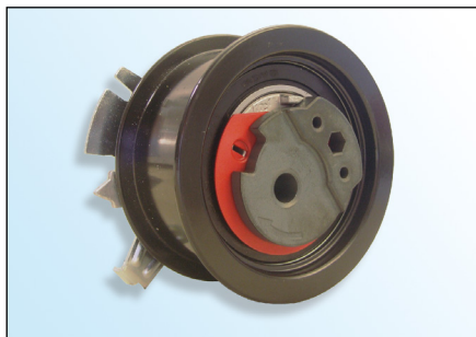
Obrázok 1: 531 0628 30 (staré vyhotovenie)