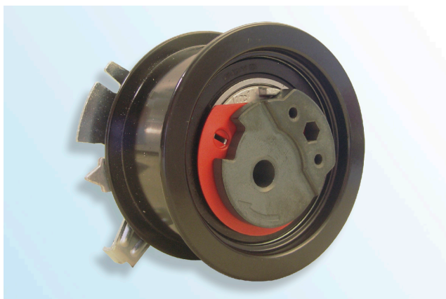
Figura 1: 531 0628 30 (versiune veche)

La montarea „noii versiuni“, asigurați-vă că stratul de acoperire al rolei întinzătoare nu este deteriorat!