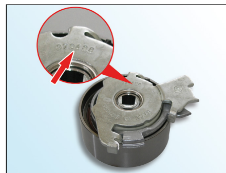
Slika 2: 531 0626 30 (979488)

Pri montaži navedenih napenjalnih valjev pazite, za katero vozilo velja posamezni valj. Na zunanji strani se oba tipa enaka.