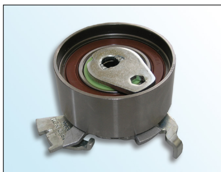
Slika 1: 531 0626 30 (979488)