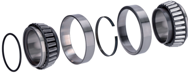
Resim 2: Kompakt Ünite

RIU kurulurken verilen ABS halkası kullanılmalıdır. Orijinal döner mil keçesi kafesi yeniden kullanılmamalıdır.