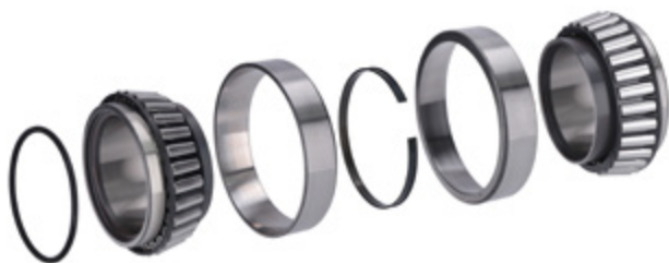
Fig. 2: Unidade de inserção

O anel ABS fornecido deve ser instalado aquando da montagem da RIU. O anel original para o ABS não deve ser reutilizado.