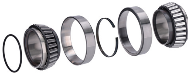
Figura 2: Insert Unit

L'anello ABS in dotazione deve essere montato durante il montaggio della RIU! L'anello di tenuta originale non deve più essere utilizzato!