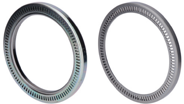
Fig. 1: El anillo original para el ABS (izquierda) ya no se debe utilizar. En su lugar, se debe instalar el anillo ABS (derecha) suministrado con el RIU.

Consultar la asignación actual en el catálogo de piezas