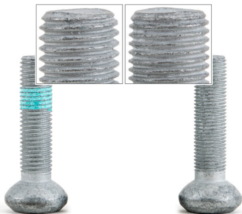
Рисунок 1: Резьба слева: M12x1,5 Резьба справа: M12x1,25

При конвейерной сборке автопроизводитель устанавливал однотипные ступичные узлы, но с разным шагом резьбы.