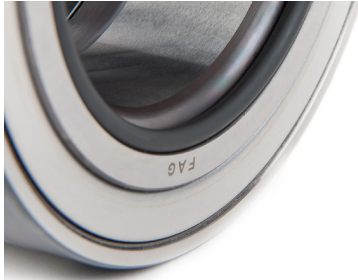
Kuva 2: Truck Hub Unit (pyörän navan laakeriyksikkö) O-renkaalla

Seuraavassa taulukossa on esitetty laakeriyksikköjen ominaisuudet ja asennussuunta.