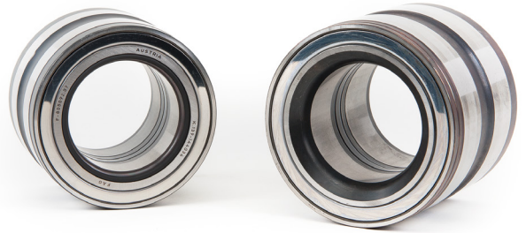
Kuva 1: Truck Hub Unit (pyörän navan laakeriyksikkö) tiivisterenkaalla (vasemmalla) tai pyörästetyllä reunalla (oikealla) laakerin sisärenkaassa

Tuotenumero: 805003CA.H195 805011C / 805011.03.H195 805012.06.H195 805092.07 / 805092.07.H195 571762.01.H195 803194.26 / 803194.26.H195 805003A.H195