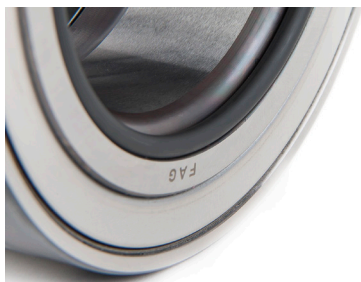
Снимка 2: Комплект главина за камион (THU) с О-пръстен

В следващата таблица са описани функцията и монтажната ориентация на лагерните възли.