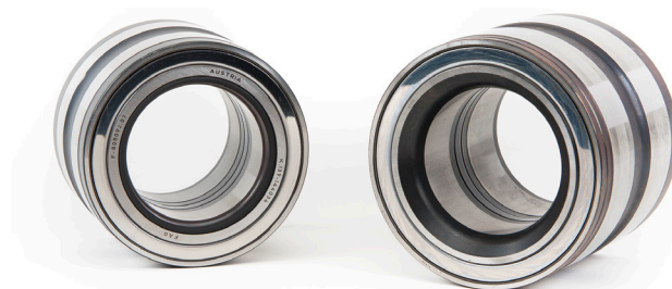
Снимка 1: Комплект главина за камион (THU) с уплътнителен пръстен (вляво) и скосен ръб (вдясно) на вътрешния пръстен на лагера

Арт. номера: 805003CA.H195 805011C / 805011.03.H195 805012.06.H195 805092.07 / 805092.07.H195 571762.01.H195 803194.26 / 803194.26.H195 805003A.H195