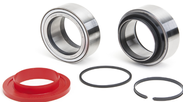
Slika 2: Nova različica (566283.01.H195)

Zaradi te tehnične spremembe je del s kataložsko št. 566283.H195 nadomestil del s kat. št. 566283.01.H195.