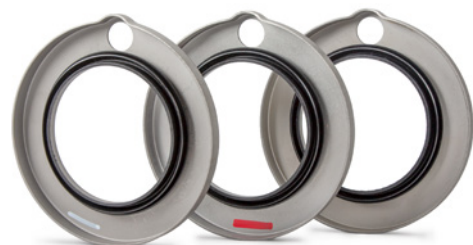
Afbeelding 3: De keerringen hebben een verschillende binnendiameter.

Neem altijd de aanwijzingen van de autofabrikant in acht.