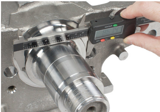
Afbeelding 2: Om te bepalen welke van de drie keerringen past, moet de diameter van de afdichtzitting worden gemeten

Let er bij de selectie op dat er 3 verschillende varianten zijn. Om de juiste keerring te identificeren, moet de diameter van de afdichtzitting worden gemeten.