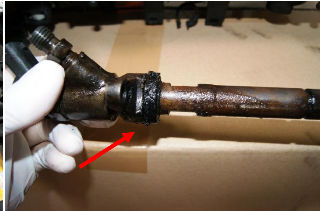
Slika 2: Držač dizne ne dihtuje- treba da se predihtuje