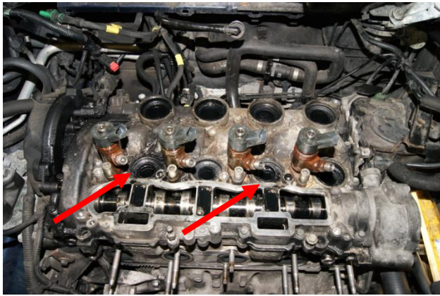
Slika 1: usisna grana- treba da se predihtuje