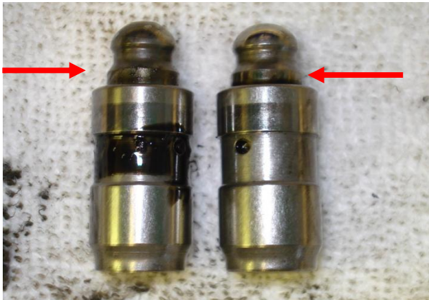
Slika 3: Hidropodizač izliven, ventil ne dihtuje nicht – zameniti hidropodizače