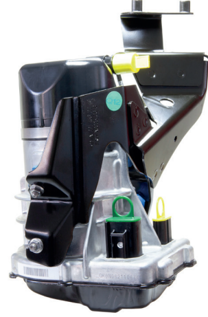
řek. 1: JER185

Araca monte edilmiř olan hidrolik direksiyon pompasının baęlantı fiřleri eski tasarıma (bkz. řek. 2 ) sahipse, eski kablo setinin yeni kablo seti (bkz. řek. 3 ) ile deęiřtirilmesi gerekir. İlgili yedek parça numaralarını ařaęıdaki tablodan öğrenebilirsiniz.