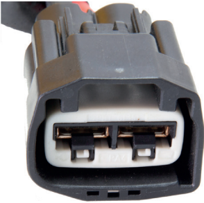
řek. 2: Eski fiř tasarımı