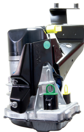
Рис. 1: JER185

Если штекеры установленного на ТС насоса усилителя рулевого управления имеют старую конструкцию (ср. рис. 2), необходимо заменить старый жгут проводов на новый (ср. рис. 3). Соответствующие номера запасных частей приведены ниже в таблице.