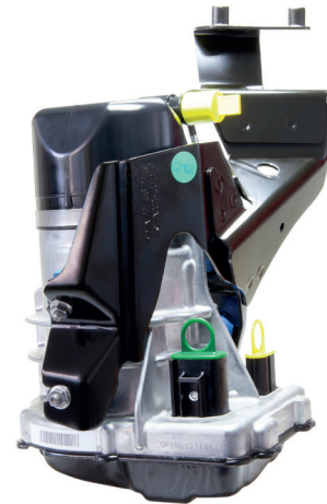
Fig. 1: JER185

Se i connettori di collegamento della pompa ausiliaria dello sterzo montata nel veicolo presentano il vecchio design (cfr. Fig. 2), il vecchio fascio di cavi deve essere sostituito con uno nuovo (cfr. Fig. 3). I numeri dei ricambi corrispondenti sono riportati nella tabella in basso.