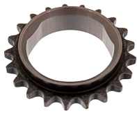
Tandwiel voor krukas SWAG 30 94 0113

geschikt voor: 1.4 TDI motoren voor verschillende modellen van Audi, Seat, Škoda en VW