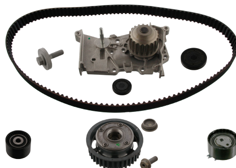
SWAG № 60 93 6444

SWAG на данный момент является единственным поставщиком, предлагающим на рынке запчастей полный комплект (SWAG № 60 93 6444), который включает в себя помимо ремкомплекта ГРМ (SWAG № 60 93 6300) также шестерню распредвала (SWAG № 60 93 6415) и водяной насос (SWAG № 60 92 1239). Этот комплект делает возможным осуществлять квалифицированный ремонт и предотвращать возможные рекламации. Это экономит СТО и клиентам время и деньги!