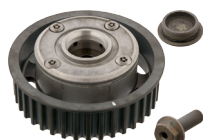
SWAG № 60 93 6415