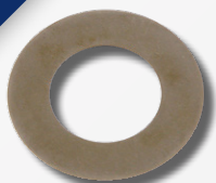
Podložka klikového hřídele s diamantovým povrchem

SWAG podložka klikového hřídele má velmi kvalitní nikl-diamantový povrch, který zabraňuje řemenici v protáčení. Navíc je zaručen optimální přenos výkonu. Aby se zabránilo nákladným následným škodám, SWAG opravné sady tlumiče vibrací pro Volvo 850, S70, S80, V70 I, V70 II, VW Crafter/T4 a Audi A6 obsahují podložky klikového hřídele s diamantovým povrchem.