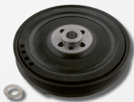
TVD opravná sada řemenice klikového hřídele